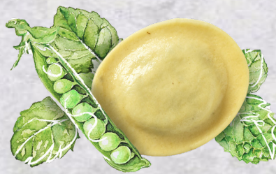
Rondelli Piselli Menta Einheit 2 x 2 kg