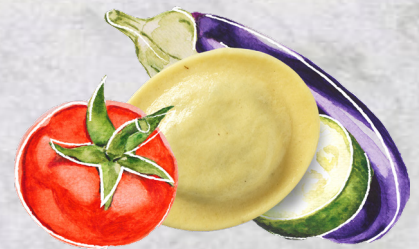
Rondelli Ratatouille Einheit 2 x 2 kg