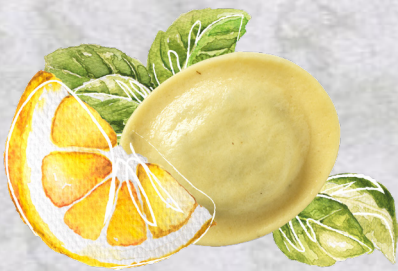
Rondelli Limone Basilico Einheit 2 x 2 kg