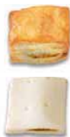
Apéro-Curryhüssi Teigling mit Ei bestrichen