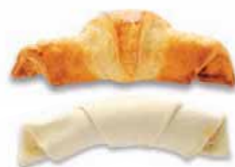
Party-Schinkengipfel Teigling mit Ei bestrichen