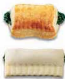
Apéro-Spinattäschli Teigling mit Ei bestrichen