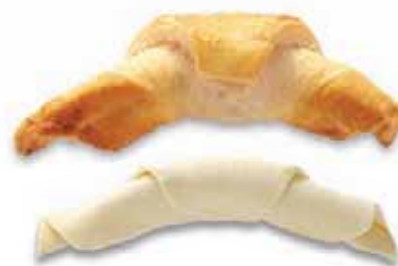
Schinkengipfel Teigling mit Ei bestrichen