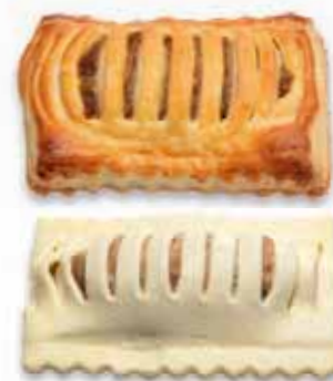
Fleischstrudel Teigling Blätterteig mit gehacktem Rindfleisch und Speck gefüllt, mit Ei bestrichen