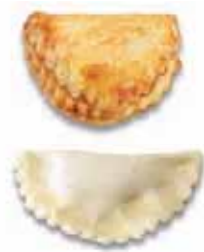
Apéro-Tomatenchröpfli Teigling mit Ei bestrichen