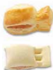
Apéro-Fleischrolle Teigling mit Ei bestrichen