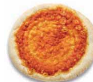
Pizza Base vorgebacken mit Tomatensauce, ø ca. 27 cm