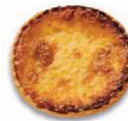
Chäschüechli vorgebacken ø ca. 9 cm