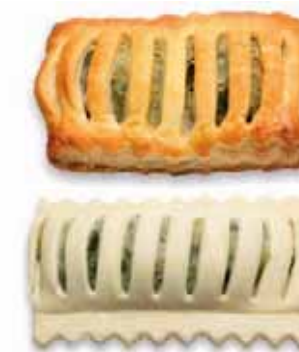
Lauchstrudel Teigling Blätterteig mit Lauchfüllung, mit Ei bestrichen