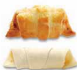
Apéro-Schinkengipfeli Teigling mit Ei bestrichen