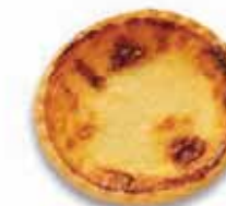
Party-Chäschüechli vorgebacken ø ca. 7 cm