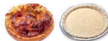
Blätterteig-Chüechli Käse Teigling ø ca. 7 cm, in Alu-Backform